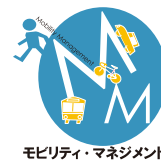
モビリティ・マネジメント

と定義されるもので、渋滞や環境、モビリティ確保や土地利用、中心市街地活性化など、多様な都市・交通問題のための“処方箋”として活用可能な、新しいタイプの交通施策です。